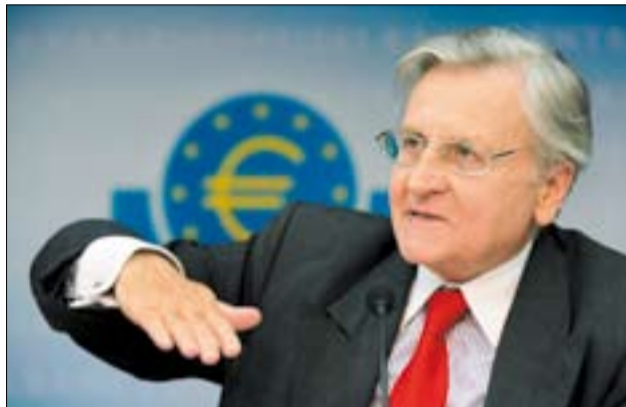
El presidente del BCE, Jean-Claude Trichet, ante la prensa.

Trichet destacó que la compra de cédulas hipotecarias forma parte del pa-