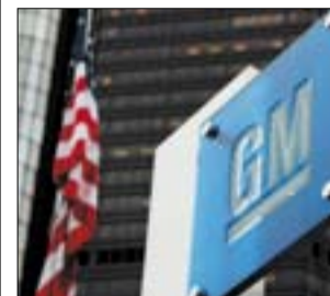
Logo de GM, en la sede de la compañía en Detroit.

WASHINGTON. General Motors perdió 6.000 millones de dólares en el primer trimestre del año, una cifra que supone prácticamente duplicar los números rojos de 3.300 millones de dólares registrados en 2008.